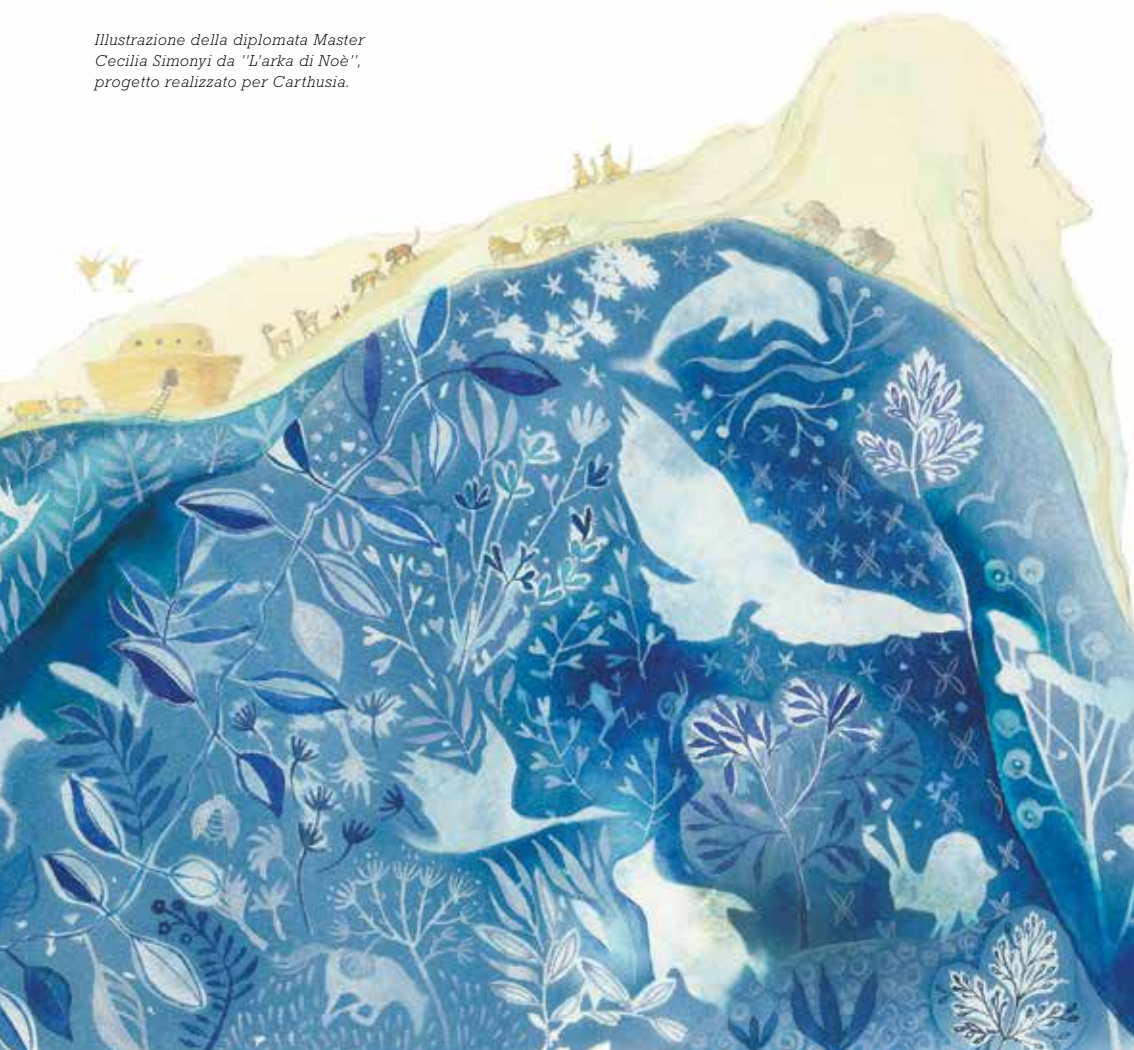
Illustrazione della diplomata Master Cecilia Simonyi da "L'arka di Noè", progetto realizzato per Carthusia.

Tre percorsi formativi distinti e coordinati per affrontare l'illustrazione e la progettazione del libro illustrato a partire dalle basi ed arrivare alla professionalizzazione con l'alta formazione master. Se desideri diventare un illustratore professionista Ars in Fabula mette a tua disposizione percorsi formativi pensati per soddisfare le tue esigenze.