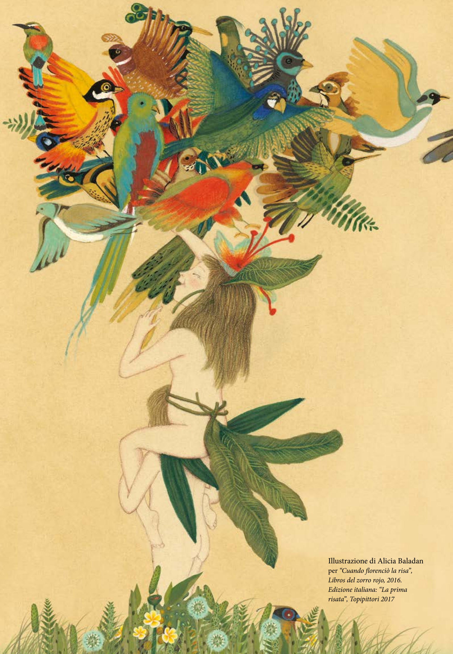
Illustrazione di Alicia Baladan per "Cuando florenció la risa", Libros del zorro rojo, 2016. Edizione italiana: "La prima risata", Topipittori 2017