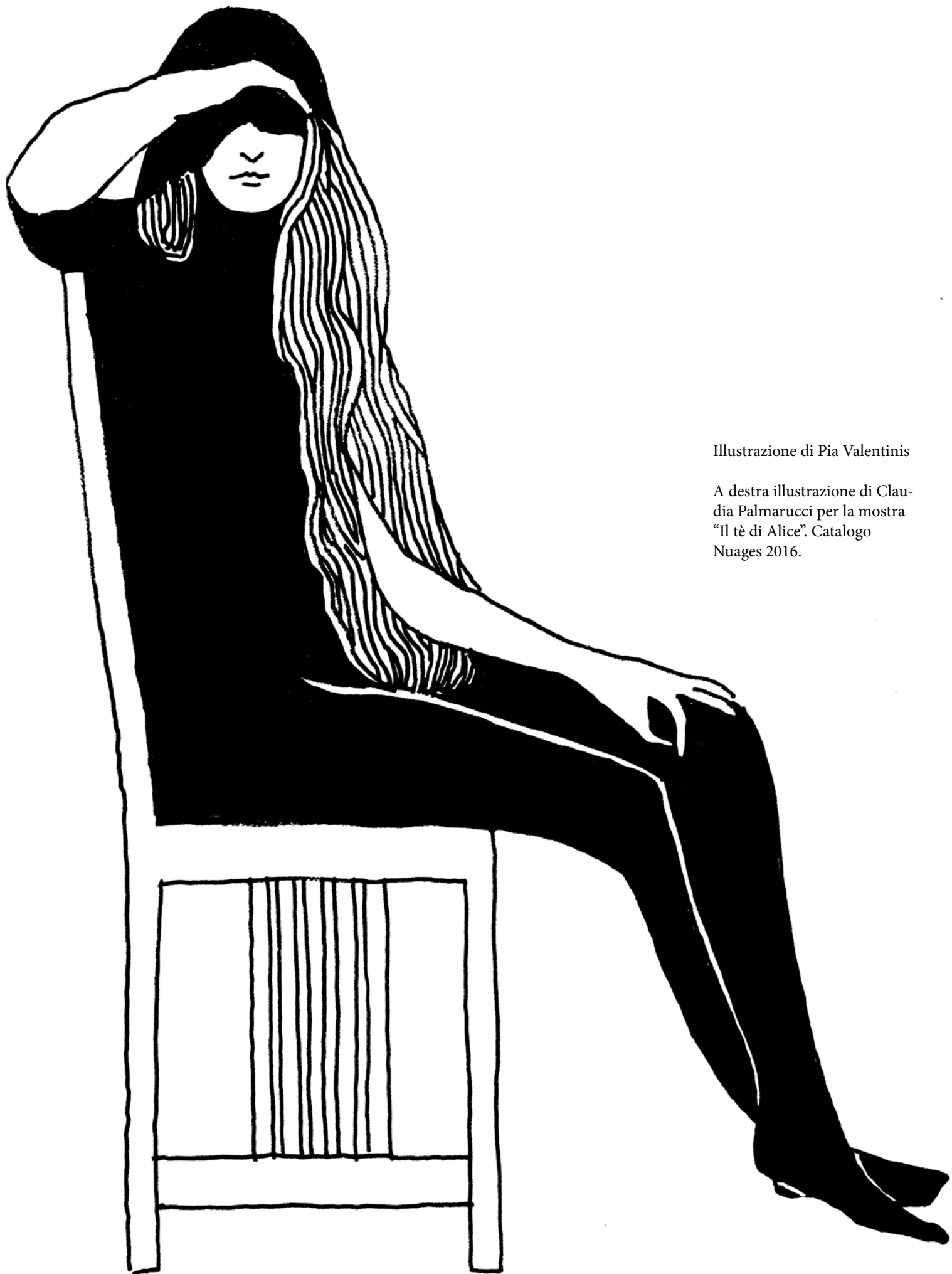
Illustrazione di Pia Valentinis

A destra illustrazione di Claudia Palmarucci per la mostra "Il tè di Alice". Catalogo Nuages 2016.